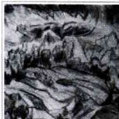
Beschlagnahmt und gerettet: Fritz Schaefflers »Pflügender Bauer«.

Magdeburg/Berlin Teilen statt bündeln: Mit 21103 Einträgen und 12221 Bildern bildet die Mitte April im Internet platzierte Datenbank zur Geschichte der von den Nazis verbotenen Bildern der Freien Universität (FU) Berlin zwar die bislang umfangreichste Datenbank zur »Entarteten Kunst«. Allerdings: